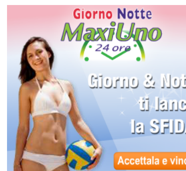
PHOTO OF THE DAY